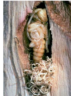
6. Puppe / Spanpolsterpuppenwiege