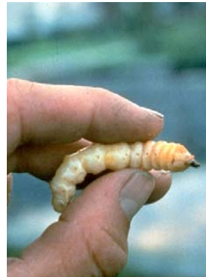
5. Bis zu 5 cm große Larven