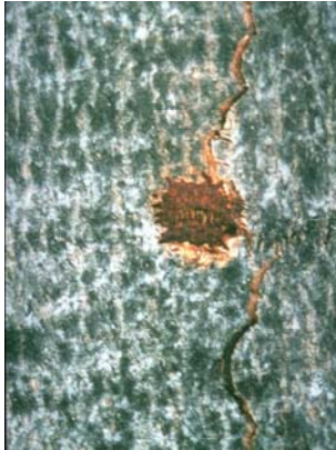
1. In die Rinde genagte Eiablagestelle