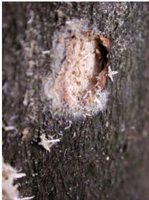
3. Eiablagestelle u. ovales Einbohrloch