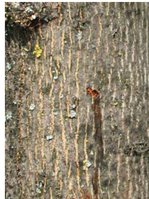
4. Nagestelle mit Safffluss

Erste Anzeichen eines Befalls durch den ALB sind die von den weiblichen Käfern in die Rinde genagten runden oder ovalen, bis zu 1,3 cm großen Eiablagegruben (Abb. 1), in die jeweils 1 weißlich-cremefarbenes, 5 - 7 mm großes, ovales Ei (Abb. 2) platziert wird. Als Folge der Rindenverletzung tritt an diesen Stellen oft Safffluss aus (Abb. 4), der Wespen und Hornissen anlockt. Die aus dem Ei schlüpfende Larve nagt sich in die Rinde ein (Abb. 3) und miniert zunächst im Kambium, bevor sie sich in den Holzkörper einbohrt. Vollständig entwickelte Larven (Abb. 5) erreichen bis zu 5 cm Länge und verursachen große ovale Bohrgänge (Ø bis 3 cm; Abb. 7, 8) im Holz. Durch den Larvenfraß findet man am Stammfuß befallener Bäume grobe Bohrspäne. Die Verpuppung (Spanpolsterpuppenwiege, Abb. 6) und Weiterentwicklung zum Käfer erfolgt im Holz. Der fertig entwickelte schwarze, weißfleckige, bis zu 3,5 cm große Käfer verursacht beim Ausbohren charakteristische runde, bis 1 cm große Ausflughöcher (Abb. 9). Starker Befall führt zum Absterben der Bäume (Entlaubung, Rinde löst sich vom Stamm, Abb.10).