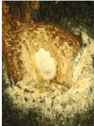
2. Weißliches, 5-7mm großes Ei