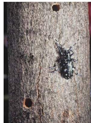
9. Runde, große Ausflughöcher